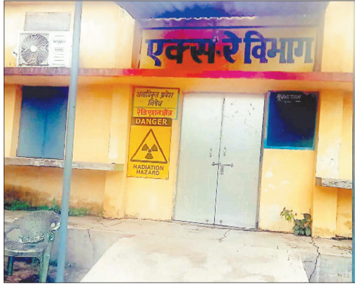
बंद एक्स-रे कक्ष।

ग्रामीण क्षेत्रों में स्वास्थ्य सुविधा का लाभ क्षेत्र के लोगों को उपलब्ध हो तथा समय पर मरीज का उपचार हो सके इसके मद्दे नजर सामुदायिक स्वास्थ्य केन्द्र की स्थापना की गई है। स्वास्थ्य विभाग द्वारा लोगों की सुविधा के लिए भैयाथान सामुदायिक स्वास्थ्य केन्द्र में एक्स रे की सुविधा उपलब्ध कराई गई है जिससे मरीजों को लाभ मिल सके लेकिन अस्पताल प्रबंधन की लापरवाही व टेक्नीशियन के मनमानी रवैया के कारण मरीजों को इसका लाभ नहीं मिल रहा। आलम यह है कि एक्स रे मशीन पिछले एक परखवाड़े से खराब पड़ी है लेकिन मरम्मत कराने किसी ने सुध लेना भी मुनासिब नहीं समझा जिसका खामियाजा अस्पताल आने वाले मरीजों को न सिर्फ धुगतना पड़ रहा है बल्कि एक्स रे कराने दर दर भटक रहे हैं। भैयाथान अंतर्गत ग्राम पंचायत के लोग स्वास्थ्य सुविधाओं के लिए सामुदायिक स्वास्थ्य केन्द्र पर निर्भर हैं। हर रोज बड़ी संख्या में आसपास गांव के लोग उपचार सहित जांच कराने अस्पताल आते हैं। सामुदायिक स्वास्थ्य केन्द्र में लोगों की भीड़ होने तथा एक्स-रे जैसे सुविधा नहीं होने