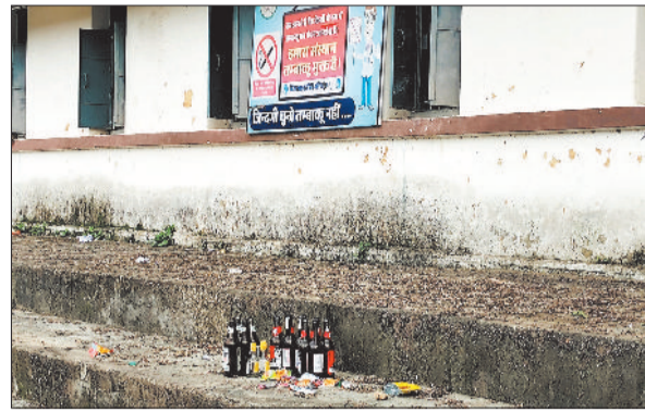
विद्यालय परिसर में शराब की बोतलें।

हरिभूमि न्यूज | चरचा कॉलरी एसईसीएल के बैकुंठपुर क्षेत्र अंतर्गत चरचा आरओ, जोहिला, पंडोपारा एवं कटकोना माईस को मिलाकर गठित बैकुंठपुर एरिया में बीएमएस यूनियन ने इस वर्ष सदस्यता सत्यापन में ऐतिहासिक जीत दर्ज की है। चरचा क्षेत्र की प्रतिष्ठित यूनियन वरिफिकेशन प्रक्रिया 19 एवं 21 जुलाई को संपन्न हुई। इसमें बीएमएस यूनियन को 721 कर्मचारियों का विश्वास प्राप्त हुआ। कांग्रेस समर्थक इंटक यूनियन से 222 मतों के भारी अंतर से बीएमएस ने पहला स्थान हासिल किया। यूनियन वरिफिकेशन के